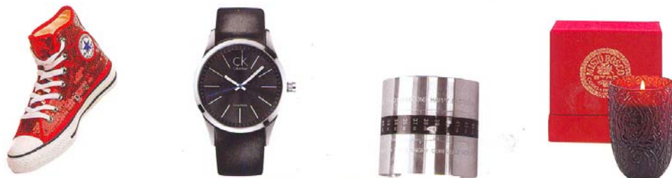
CON PAILLETES All Star de fiesta de Converse (110 €), CLÁSICO Reloj modelo New Boldgent de CK (160 €), RÍGIDO Brazaletes de Maison Martin Margiela (625 €), LABRADA Vela de Etno (80 €).

Juegos, fiestas y noches llenas de sofisticación en casa. La Navidad se declina en versión lujo con el rojo como protagonista.