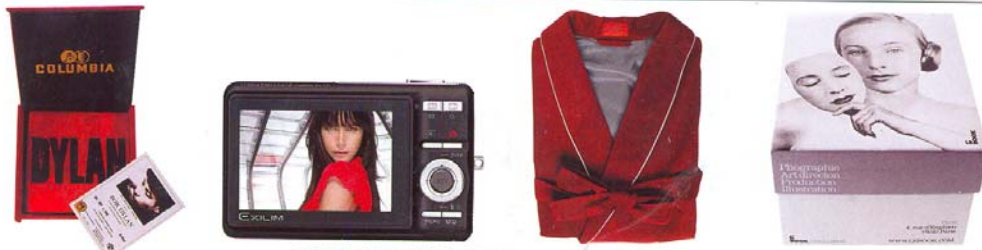
DE COLECCIONISTA Caja de Bob Dylan de Columbia (45 €), OVERSIZE Cámara de fotos Exilim Z77 de Casio (180 €), MICROPANA Batín granate de Mirto (120 €), EN CAJA Le Book Paris 2008, el quién es quién en la moda, de Le Book (249 €).