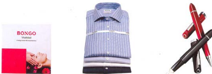
BONO SALUD Canjéalo en más de 40 establecimientos de toda España, de Bongo (60 €), PREMIUM Juego de camisas de Arrow (90 €), A MANO Estilográfica roja de plata (2.080 €) y negra de titanio de Omas (295 €).